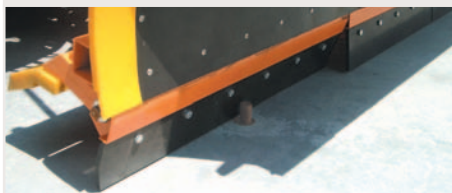
Schema für die Hindernisüberquerung mit Stahlraumleiste